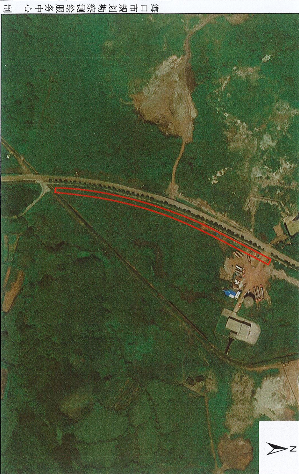
海南新能源汽车体验中心（二期）羊山补水渠迁改项目（一期）卫星遥感影像 （2023年8月）